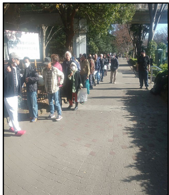
写真2-食料を受け取るホームレスの方々